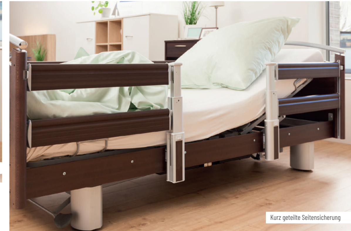
Kurz geteilte Seitensicherung