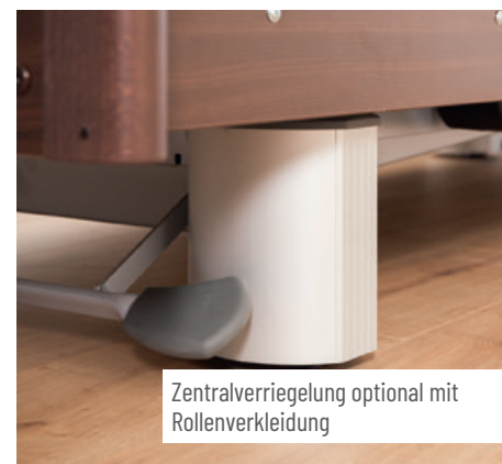
Zentralverriegelung optional mit Rollenverkleidung