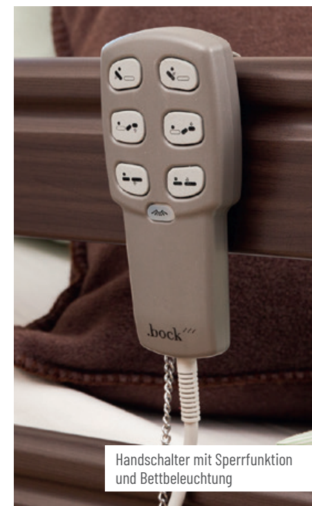
Handschalter mit Sperrfunktion und Bettbeleuchtung

Nicht zuletzt sorgen die robuste Konstruktion und langlebige Materialien dafür, dass das livorno niedrig eine Investition ist, die sich rechnet.